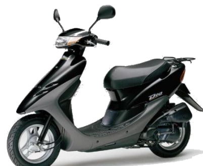
Защита от угона скутеров