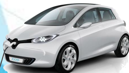
Защита от угона электромобилей