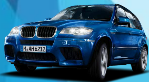
Защита от угона автомобилей